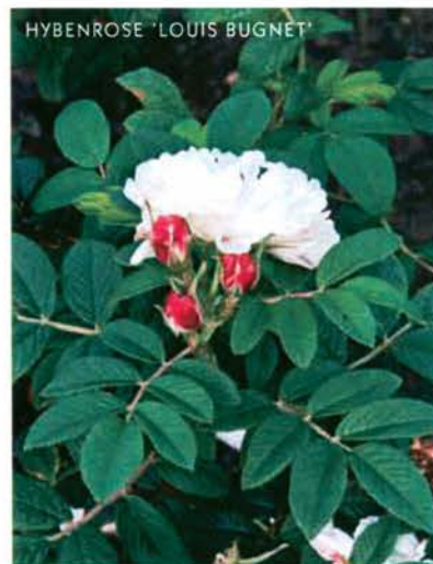
HYBENROSE 'LOUIS BUGNET'