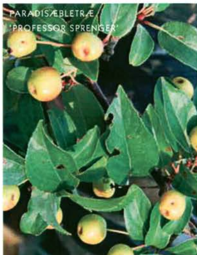
PARADISÆBLETRÆ 'PROFESSOR SPRENGER'