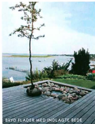
BRYD FLADER MED INDLAGTE BEDE