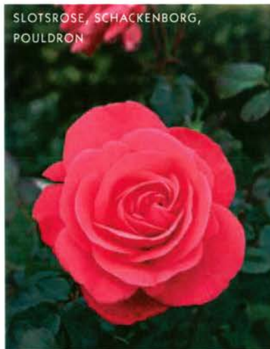
SLOTSROSE, SCHACKENBORG, POULDRON