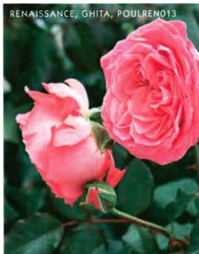
RENAISSANCE, GHITA, POULRENO13