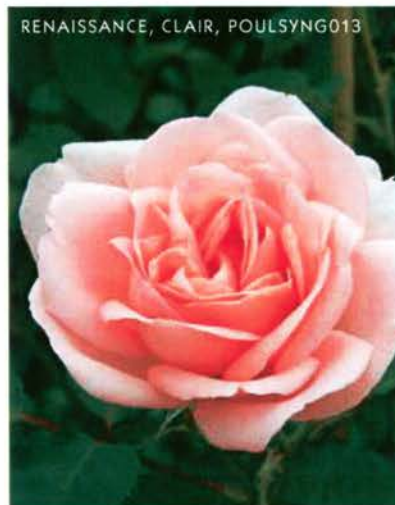
RENAISSANCE, CLAIR, POULSYNG013