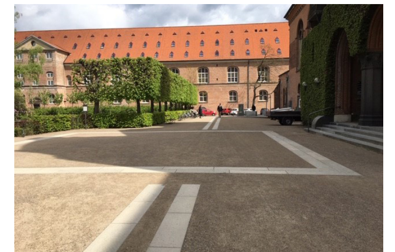
Spor i granit forbinder bygningerne og gør adgangen lettere for bevægelseshæmmede.