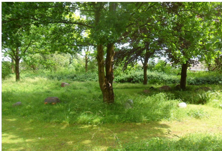
Gravstenene ligger langs et klippet spor i græsset.