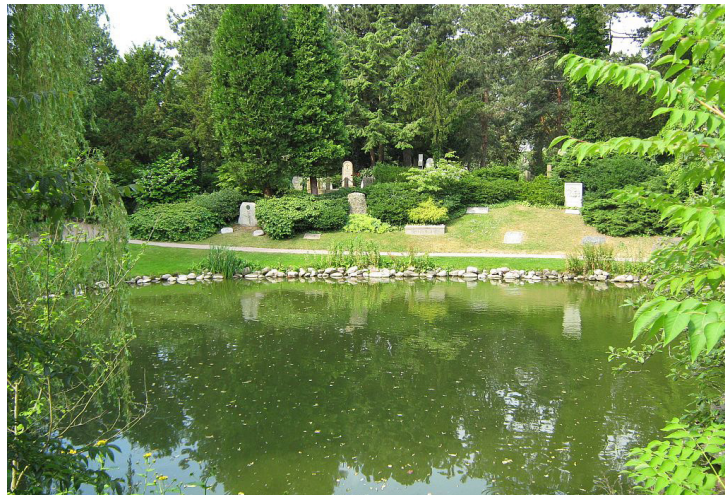
Rundt om søen holdes græsset klippet, så det er muligt at komme tæt på vandet.