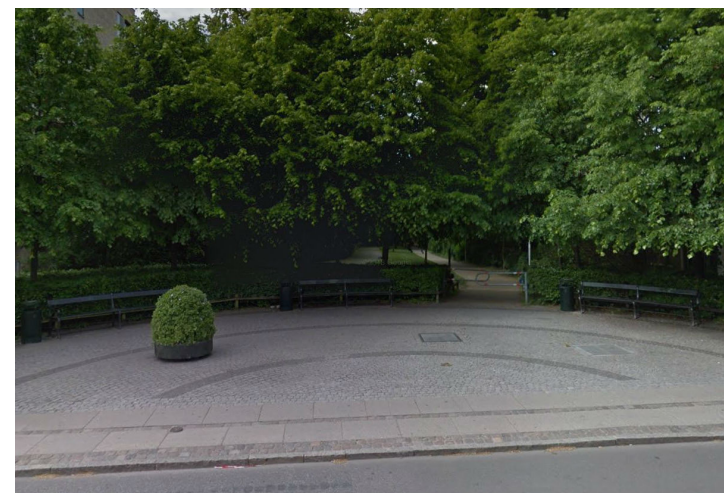
Ankomstpladserne indikerer, at nu er den besøgende ankommet til kirkegården.

Den eksisterende gårdsplads har fået en opgradering i form af belægningsbånd, der forbinder bygningerne og gør det lettere at færdes med barnevogn og kørestol på arealet. Under det eksisterende træ placeres en rund bæk, der giver rum til fordybelse.