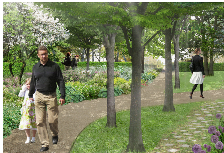
Den fælles staudeplantning bidrager med stor årstidsvariation, og er et anderledes bud på et gravafsnit, der smukt supplerer Hother's Høj med sin naturlige fremtoning.